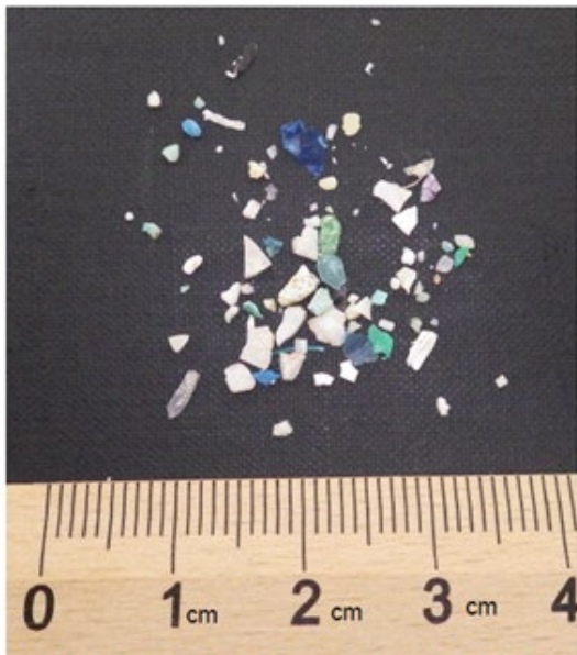
日本列島から1000km離れた太平洋上で気象庁が採取したマイクロプラスチック。これにも有害な化学物質が含まれています。

日本学術会議の報告書より引用(令和2年(2020年)4月7日日本学術会議「健康・生活科学委員会・環境学委員会合同環境リスク分科会」)