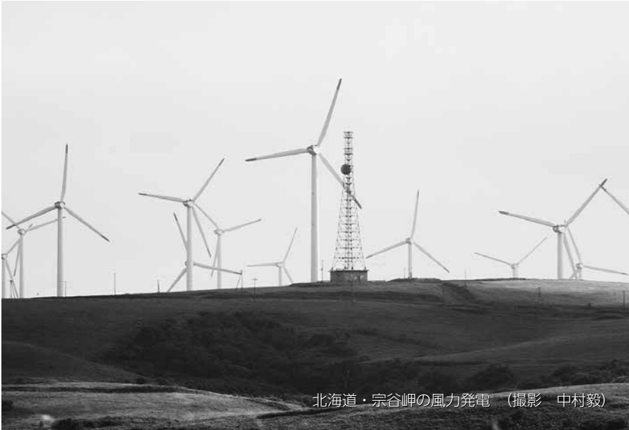
北海道・宗谷岬の風力発電 (撮影 中村毅)

大阪から公害をなくす会 〒540-0026 大阪府中央区内本町2-1-19 内本町松屋ビル10 370号 TEL 06-6949-8120/FAX 06-6949-8121 E-mail : oskougai@coast.ocn.ne.jp URL http://oskougai.com/ 発行責任者 金谷 邦夫 年間購読料一部2,000円(送料共)